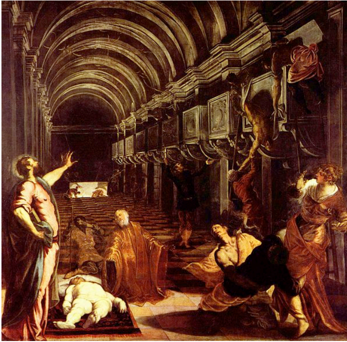
Tintoretto. Hallazgo del cuerpo de San Marcos (1562-66).