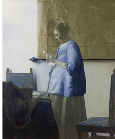
Vermeer, Mujer leyendo una carta (1663-64)