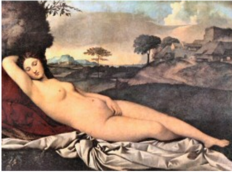
Giorgone, Venus (1510)