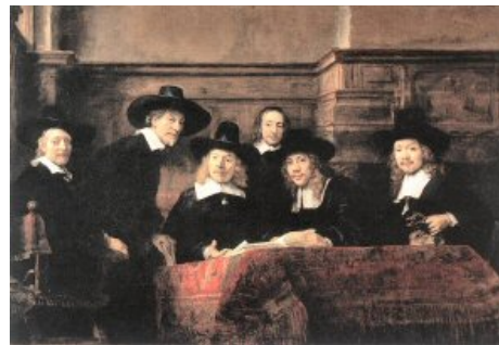
Rembrandt (Leiden 1606-Amsterdam 1662) Sindicos .

A. VON HILDEBRAND. El problema de la forma en la obra de arte (1893). Madrid, Visor, 1988.