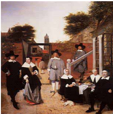
Pieter de Hooch. Familia holandesa, ca. 1662