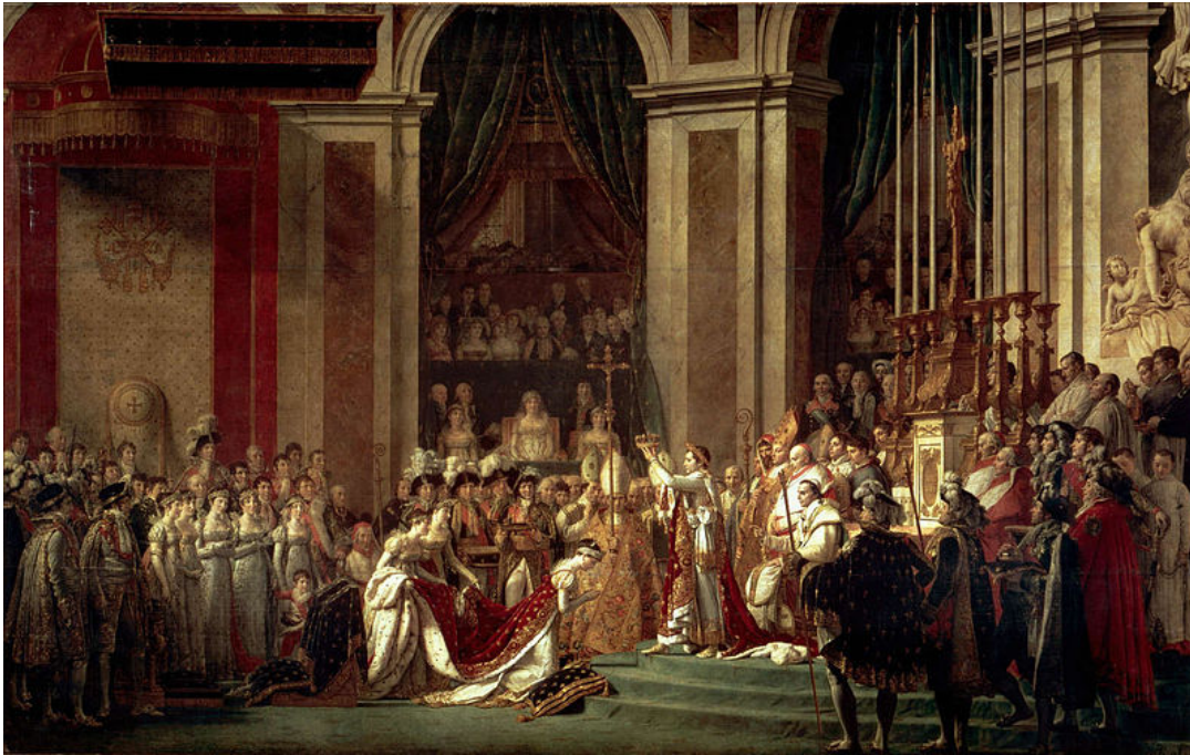
J.L. David. La coronación de Napoleón (1805)

El cuadro de J.L. David La consagración del emperador y la coronación de la emperatriz Josefina (2 diciembre 1804) proporciona una oportunidad para tratar una serie de cuestiones sobre ideología y sus condiciones económicas y sociales de producción. David había sido nombrado pintor oficial de Napoleón y se le encargó producir una serie de 4 grandes cuadros que documentaran su coronación, de los cuales sólo 2 se llevaron a cabo