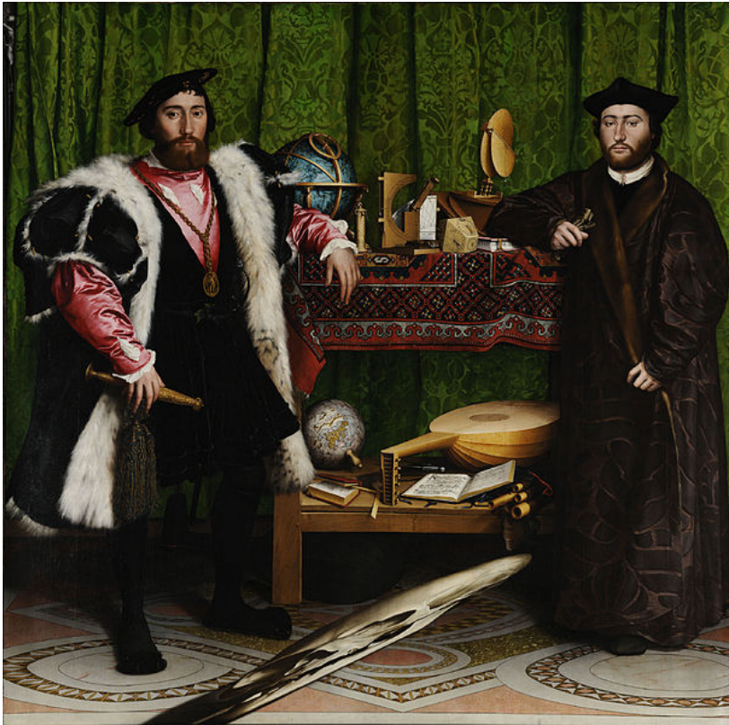
Hans Holbein el Joven. Los embajadores (1533)