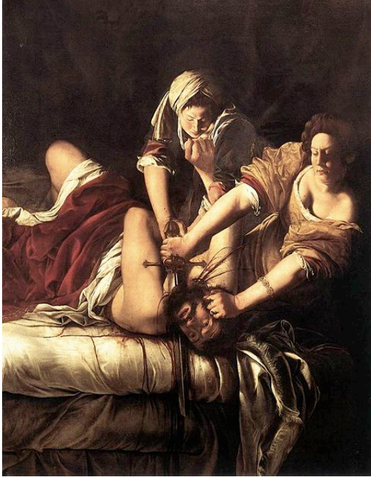
Artemisia Gentileschi. Judith decapitando a Holofernes (1614-1620)

Estas son algunas cuestiones que se pueden formular sobre esta obra desde una perspectiva feminista: