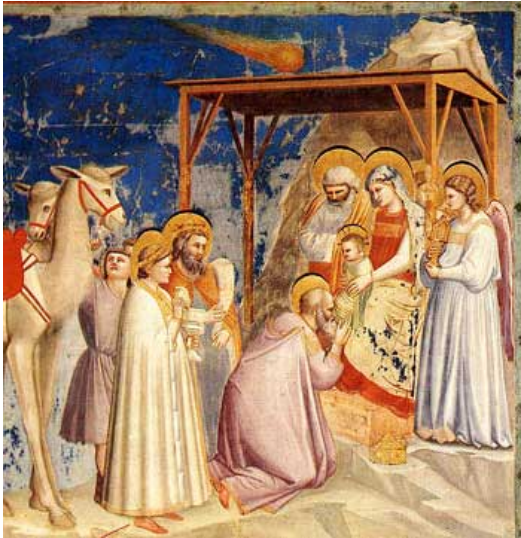
Giotto. Nacimiento. Capilla Scrovegni, Padua 1304-5

“La gratitud que deben los artistas pintores a la Naturaleza, que sirve siempre de modelo a aquellos que se las ingenian para extraer de ella sus partes más admirables y hermosas con el fin de reconstruirla en sus representaciones, esa misma deuda la tiene con Giotto. Porque después de haber estado la norma y el dibujo de la buena pintura tantos años enterrados debido a los desastres de la guerra, él solo, aunque formado entre artistas ineptos, resucitó con don celestial lo que se había extraviado y lo condujo a lo que consideramos la buena forma. Y fue realmente milagroso que en esa edad ruda e inepta surgiera el vigor de Giotto para pintar tan sabiamente que el diseño, del que los hombre de aquel tiempo tenían poco o ningún conocimiento, resucitó completamente con él”