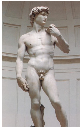
Miguel ángel, David (1501-4)

“...esforcémonos por comprender la obra de arte como miembro de una secuencia temporal en lugar de considerarla aisladamente. Desde el instante en que el enfoque histórico de la obra es empleado como control de apreciaciones surgidas del análisis de obras particulares, se introduce un nuevo objeto de investigación: el acontecer histórico; habremos de comprender las obras particulares como manifestación de un decurso. Es distinto decir que dos obras separadas en el tiempo, A y B, son distintas porque difieren en determinados puntos, es decir que algo ha cambiado, que