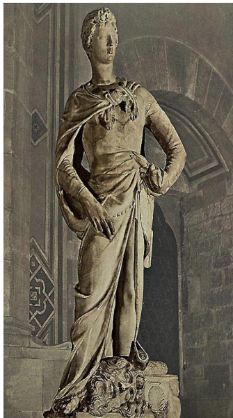
Donatello, David (1417 ca.)

“La obra de arte particular como eslabón de una secuencia temporal”