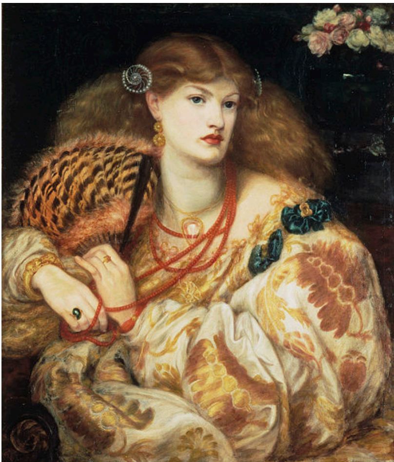
Dante Gabriel Rosseti, Monna Vanna (1866)