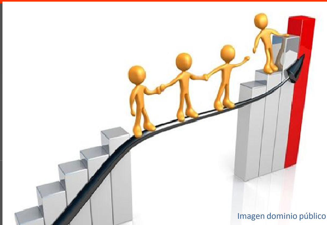
Imagen dominio público