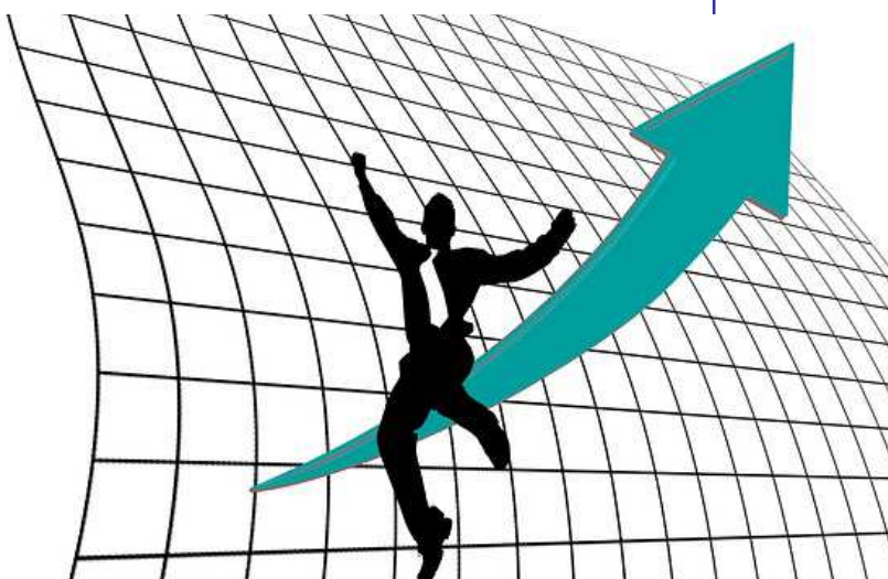
Imagen dominio público