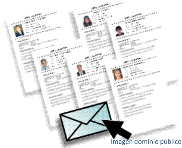
Imagen dominio público