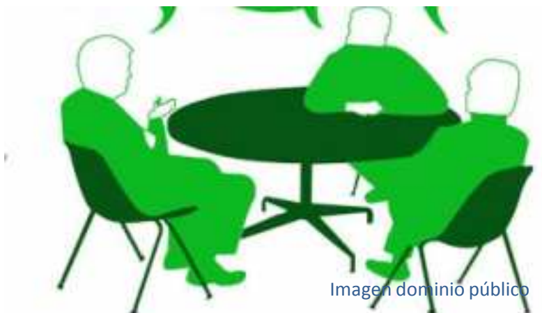
Imagen dominio público